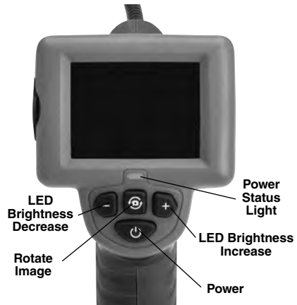
Figure 2 – Controls