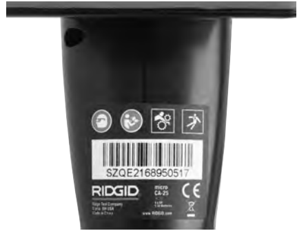
Figure 6 – Warning Label