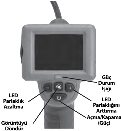
Şekil 2 - Kumandalar