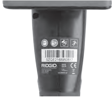
Şekil 6 – Uyarı Etiketi