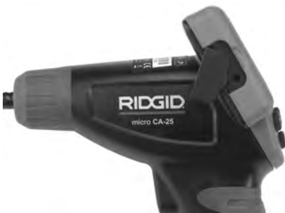
Figure 8 – TV-OUT Jack

Insert the other end into the Video In jack on the television or monitor. The television or monitor may need to be set to the proper input to allow viewing.