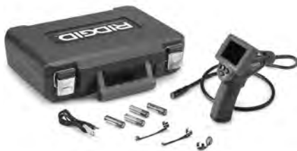
Figure 1 – Caméra d'inspection micro CA-25