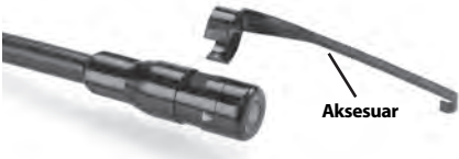
Şekil 5 – Aksesuarların Yerleştirilmesi

Bağlamak için, kamera kafasını Şekil 5 üzerinde gösterildiği gibi tutun. Aksesuarın yarım daire ucunu, Şekil 5'te gösterilen şekilde kamera kafasının içerisine kaydırın. Daha sonra aksesuarın uzun kolu gösterildiği gibi uzanacağı şekilde aksesuarı 1/4 tur döndürün.