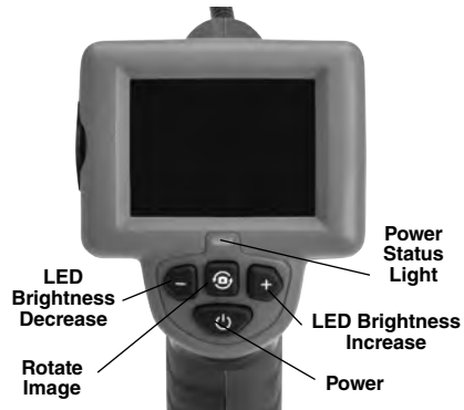
Figure 7 – Controls