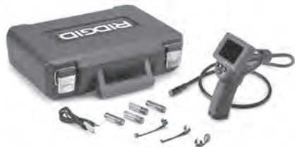
Şekil 1 – micro CA-25