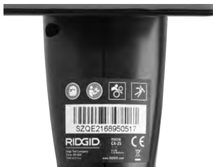
Figure 6 – Etiquette de sécurité