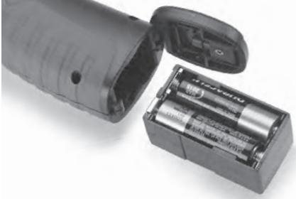
Şekil 4 – Pil Bölmesi

sadece tek yöne hareket eder. Zorlamayın. Pil kapağını kapatın, sıkıca kapatıldıktan sonra emin olun.