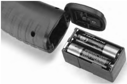
Figura 4 – Caja y compartimiento de las pilas