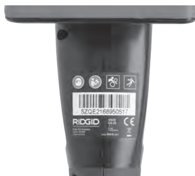
Рис. 6 – Предупредительная этикетка