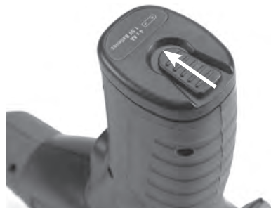
Рис. 3 – Крышка батарейного отсека