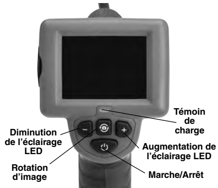
Figure 7 – Commandes