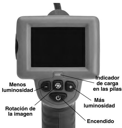
Figura 2 – Mandos