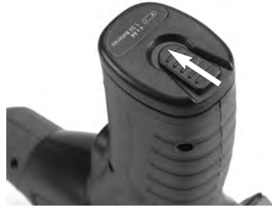
Figure 3 – Battery Door