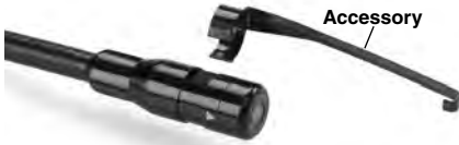
Figure 5 – Installing Accessories