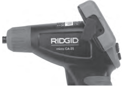
Şekil 8 – TV-ÇIKIŞ Jaki

Diğer ucunu, televizyon veya monitör üzerindeki Video Giriş yakına takın. Televizyon veya monitörün, görüntü alımını sağlamak için doğru girişe ayarlanması gerekebilir.