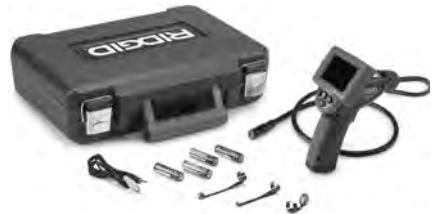
Figure 1 – micro CA-25