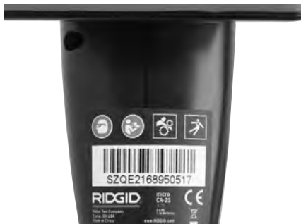
Figura 6 – Etiqueta de advertencias