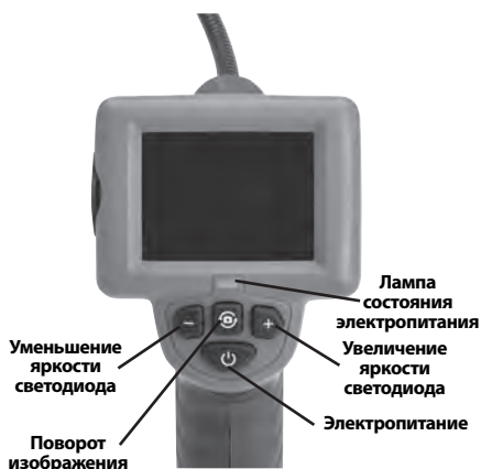
Рис. 2 – Средства управления