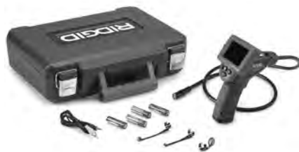
Figura 1 – micro CA-25