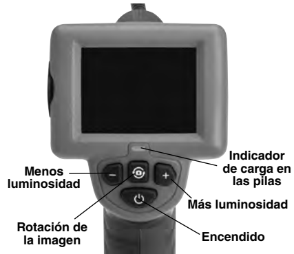
Figura 7 – Mandos