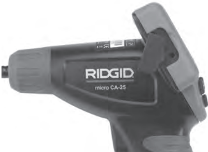
Рис. 8 – Разъем TV-OUT

Вставьте другой конец кабеля в гнездо видеовхода телевизора или видеомонитора. Возможно, для просмотра изображения на телевизоре или видеомониторе придется включить соответствующий вход видеосигнала.