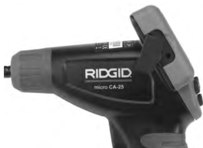
Figure 8 – Sortie vidéo TV-OUT

Introduisez l'autre fiche du câble dans la prise vidéo du téléviseur ou moniteur. Le paramétrage du téléviseur ou moniteur peut s'avérer nécessaire pour permettre la visualisation.