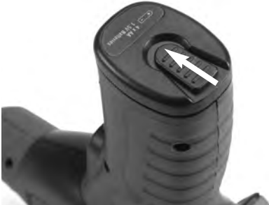
Figura 3 – Tapa del compartimiento de las pilas

CA-25 (ver Figura 4). Retire las pilas usadas de su caja, si es necesario reemplazarlas.