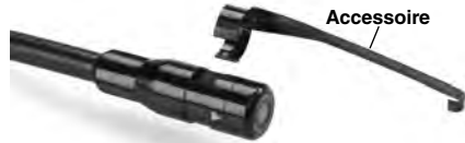
Figure 5 – Montage des accessoires

Pour ce faire, tenez la tête de caméra comme indiqué à la Figure 5, engagez la bride de l'accessoire sur la partie à méplats de la tête de caméra, puis tournez l'accessoire d'un quart de tour de manière à ce que l'accessoire soit orienté comme indiqué.