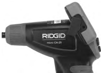
Figura 8 – Enchufe hembra TV-OUT

Introduzca el otro extremo del cable en la entrada hembra Video In en el televisor o monitor. Es posible que el televisor o monitor requieran ser regulados a la posición correcta para mostrar las imágenes siendo transmitidas.