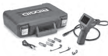
Рис. 1 – Инспекционная видеокамера micro CA-25