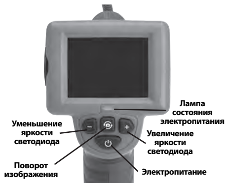
Рис. 7 – Средства управления