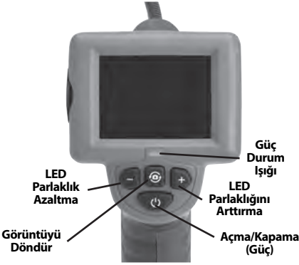
Şekil 7 – Kumandalar