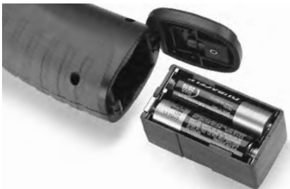
Figure 4 – Logement de piles