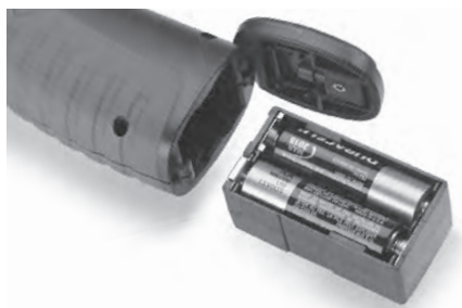
Рис. 4 – Батарейный отсек