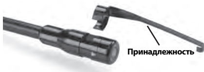
Рис. 5 – Установка аксессуаров

Чтобы прикрепить приспособление, необходимо удерживать головку формирования изображения так, как показано на рис. 5. Вставьте полукруглый конец приспособления на лыску головки формирования изображения, как показано на рис. 5. Затем поверните приспособление на 1/4 оборота так, чтобы его длинная ручка выдвигалась наружу, как показано на рисунке.